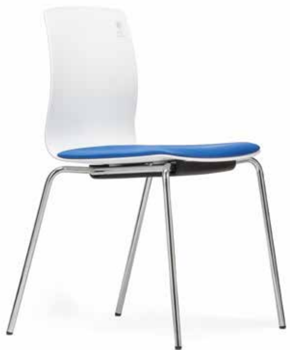
FI 7510_MCS 8-fach stapelbar | stackable up to 8-high